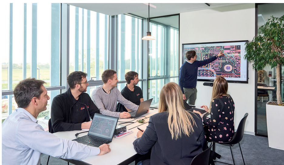
Il team R&D Flash Battery impegnato nella progettazione e validazione delle architetture elettroniche e software dei sistemi batteria