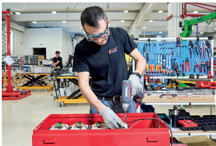
Assemblaggio dei pacchi batteria al litio Flash Battery, progettati su misura per cicli di lavoro industriali e off-highway

Il compatto DX30 BEV è la proposta full electric di Fiori, pensata per applicazioni in contesti urbani, indoor o soggetti a restrizioni sulle emissioni. Il DX30 full electric nasce da una piattaforma sviluppata da Fiori dal foglio bianco per integrare senza compromessi la propulsione elettrica